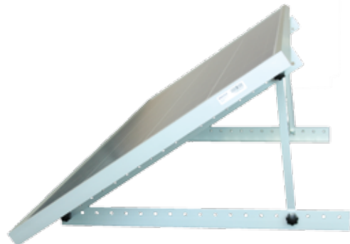
Support Structure Mono Axial Two