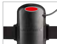
mit rotem Rücklicht